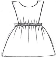
الميول المدرسي من الخلف